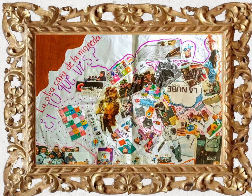
'La otra cara de la moneda. ¿Y tú qué ves?'; Excelencia académica