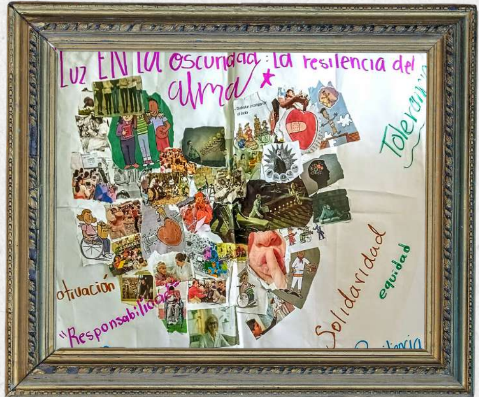
'Luz en la oscuridad: la resiliencia del alma'; Valor