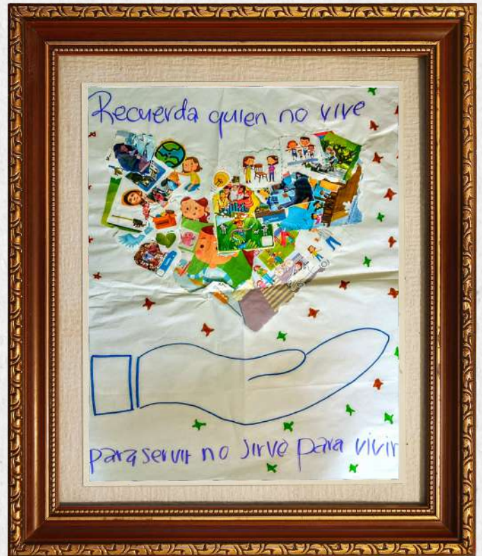
'Recuerda: quien no vive para servir, no sirve para vivir'; Servicio