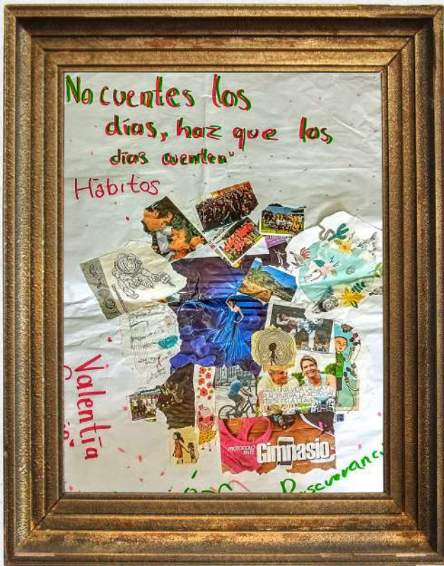
'No cuentes los días, haz que los días cuenten'; Patriotismo