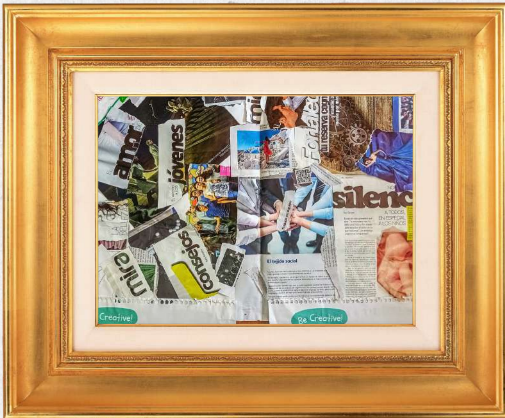
'La diferencia'; Liderazgo